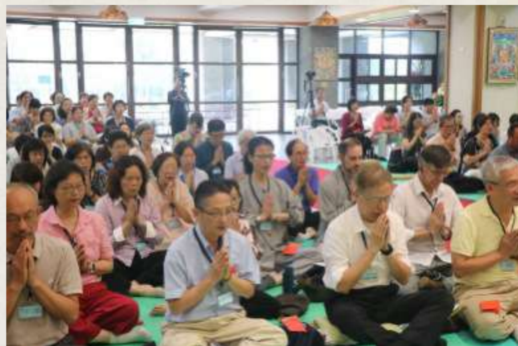
如淨和尚主持皈依法會。

同學參加請法團 都深深地感受到 師長功德！ 歡喜參加所有活 動，覺得請法是 找到「生命的 活水源頭」！