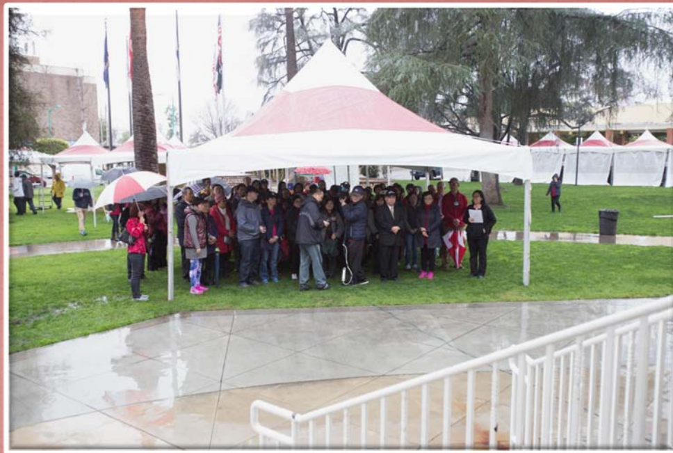
當日早上下著小雨，全體義工集聚在帳棚下聆聽上師對淨塑的開示