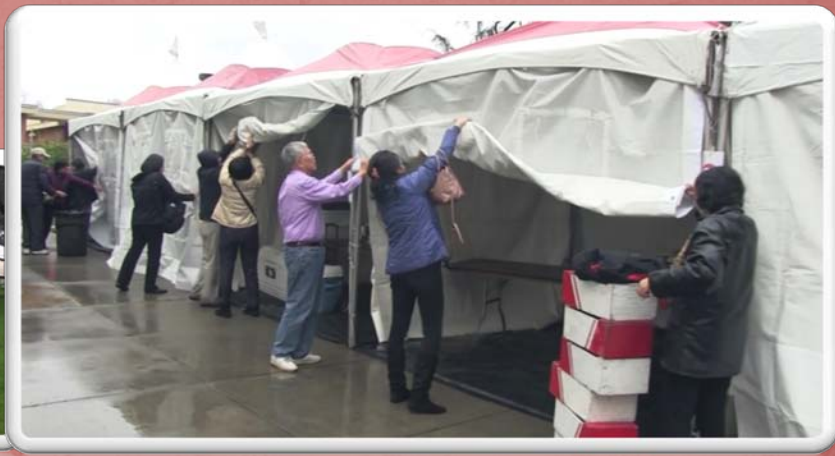
大會正式開始前，雨停下來了，大家加緊腳步布置場地